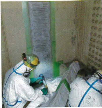
鋼橋塗り替え工事の素地調整