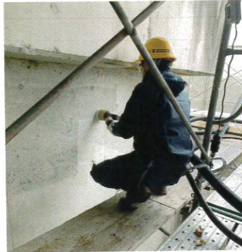
コンクリート橋脚 補強下地処理